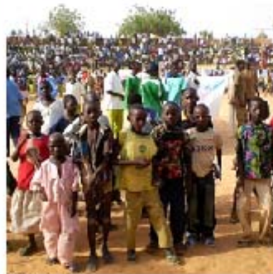
© GCE Global Action Week in Niger

Millions of people took part in Global Action Week (21-27 April 2008). UNESCO was present in all regions of the world, organizing events on the theme of "Quality education to end exclusion".